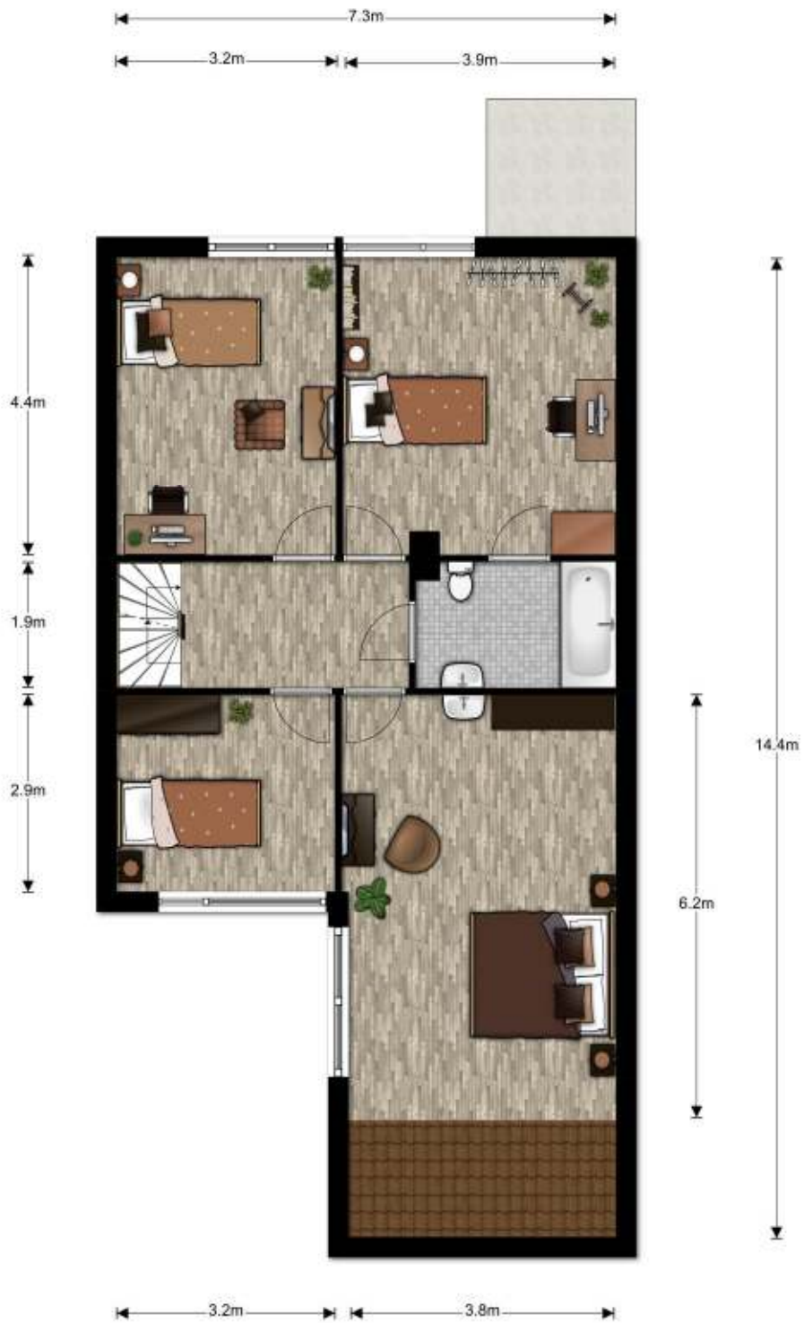
1e Verdieping, Emmalaan 46 te Haren Gr De plattegronden zijn ter indicatie en geproduceerd voor promotionele doeleinden. Aan de plattegronden kunnen geen rechten worden ontleend.