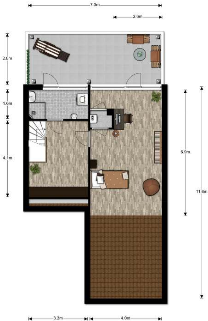
2e Verdieping, Emmalaan 46 te Haren Gn De plattegronden zijn ter indicatie en geproduceerd voor promotionele doeleinden. Aan de plattegronden kunnen geen rechten worden ontleend. © topr.nl